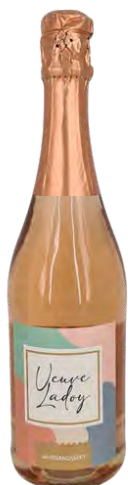
Veuve Ladoy Haussekt Rosé

Ein Klassiker unseres Hauses ist unser Rosé Sekt extra brut elegant, trocken Alkohol: 12,0 % 0,75 l