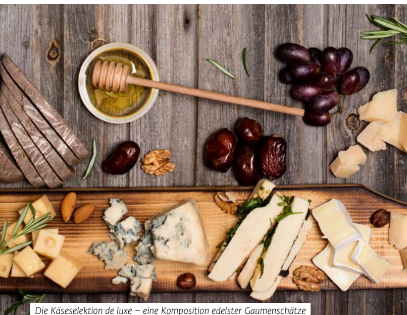
Die Käselektion de luxe – eine Komposition edelster Gaumenschätze