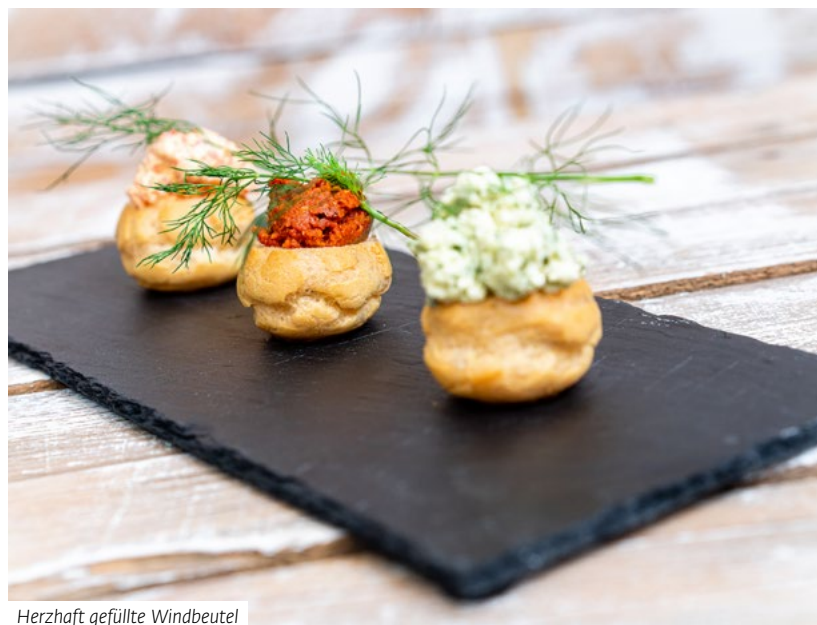
Herzhaft gefüllte Windbeutel