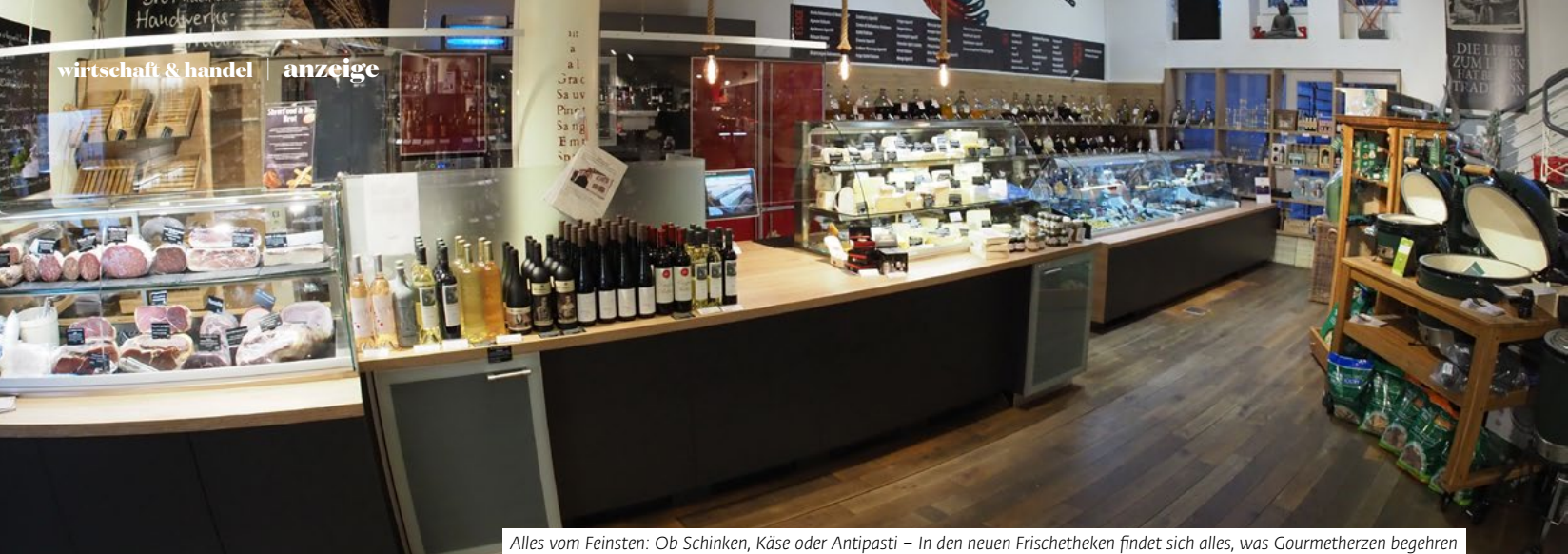
Alles vom Feinsten: Ob Schinken, Käse oder Antipasti – In den neuen Frischetheken findet sich alles, was Gourmethertzen begehren