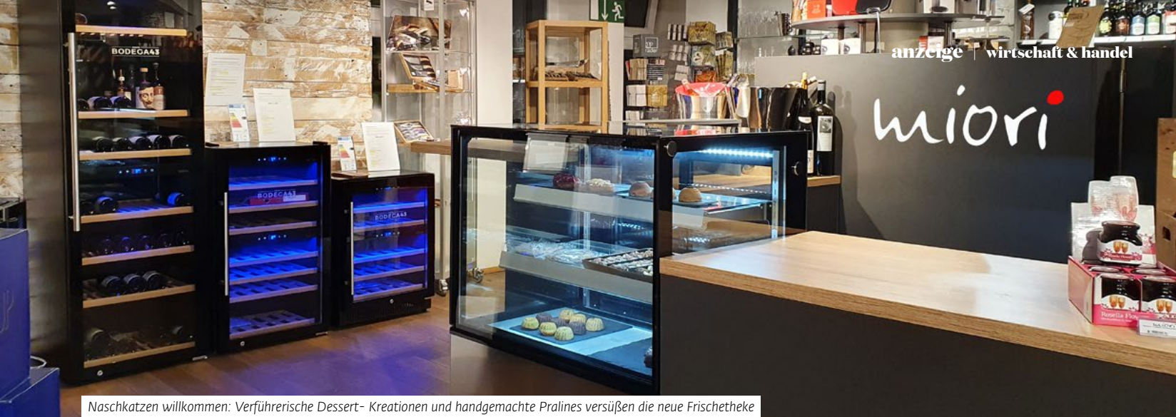
Naschkatzen willkommen: Verführerische Dessert-Kreationen und handgemachte Pralines versüßen die neue Frischetheke

Direkt aus der MIORI-Küche in die neuen Theken kommen köstliche Spare Ribs und Lachsschnitte vom Big Green Egg, Suppen, feinstes Gulasch und vieles mehr. Lassen Sie sich von dieser neuen Auswahl begeistern – und schlemmen Sie sich durch die MIORI Frischetheke!