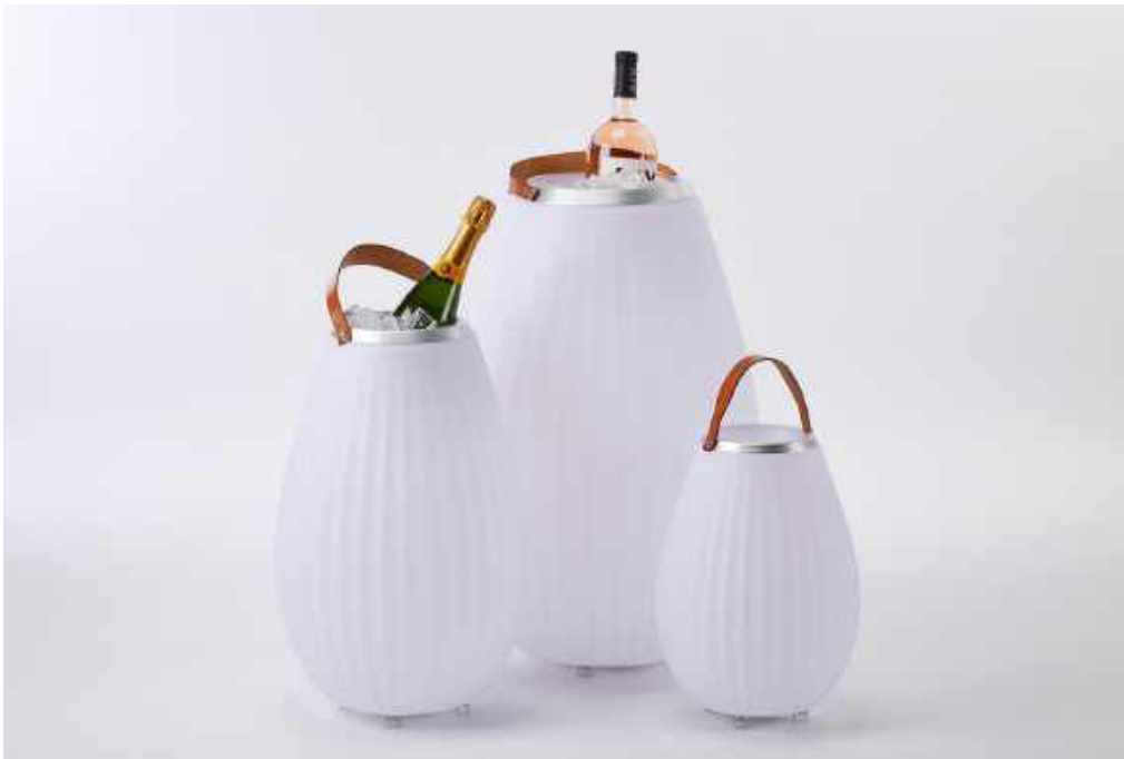
The Jooly, ein echter Tausendsassa: Getränkekühler, Leuchter und Lautsprecher für die passende Partymusik

ideal für Partys im Freien. Dieser Vielkünstler sorgt für angenehm gekühlte Kaltgetränke wie Bier, Wein oder Champagner. Er spendet außerdem dimmbares Licht in neun verschiedenen Farben für die jeweils passende Atmosphäre. Der besondere Clou: The Jooly bietet - über Bluetooth vom Smartphone oder vom PC übertragen - die passende Party-Musik. Mehrere Joolys können zur perfekten Darbietung auch kombiniert und synchronisiert werden.